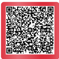
Vixargio 10 mg

Liečba hlbokaj žilovej trombózy (DVT) a pľúcnej embólie (PE) a prevencia rekurencie DVT a PE u dospelých. (3)