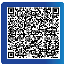
Vixargio 15 mg